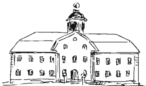
Stora gruvstugan i Falun blev museum 1922.