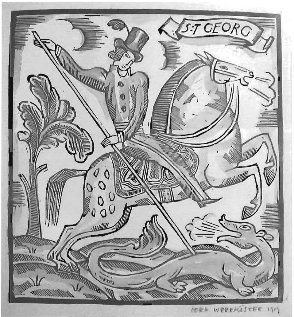
Denna bild av S:t Georg har tecknats av gillebrodern Jerk Werkmäster och överlämnas som veterangåva till de bröder, som tillhört Gillet i femtio år.